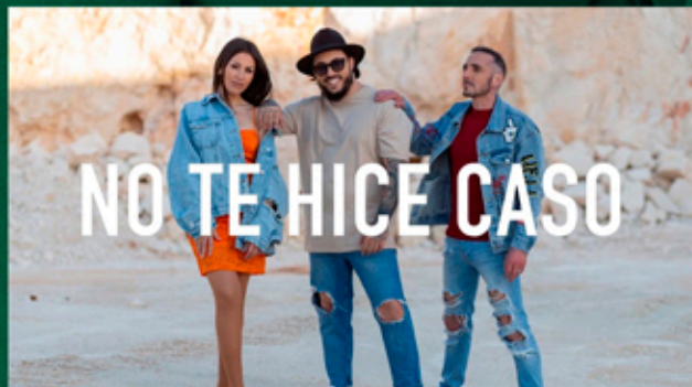
MAKI, GALVAN REAL, MARÍA ARTÉS NO TE HICE CASO